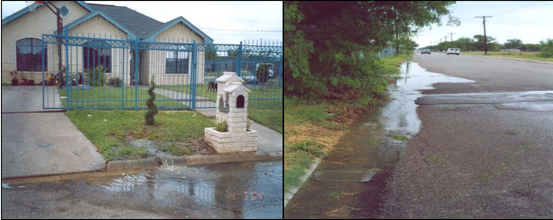
Derrames de drenaje sanitario en zonas habitacionales y calles de la ciudad

Aproximadamente 8,349 pies lineales (12.6 millas) de alcantarillado tienen un tamaño insuficiente, y la duración promedio de los derrames que se ha registrado ha sido de 5 horas. En promedio, en toda la ciudad se reportan derrames durante 17 días de cada mes. Se espera que con la Etapa I se puedan resolver estos derrames de drenaje sanitario en la ciudad.