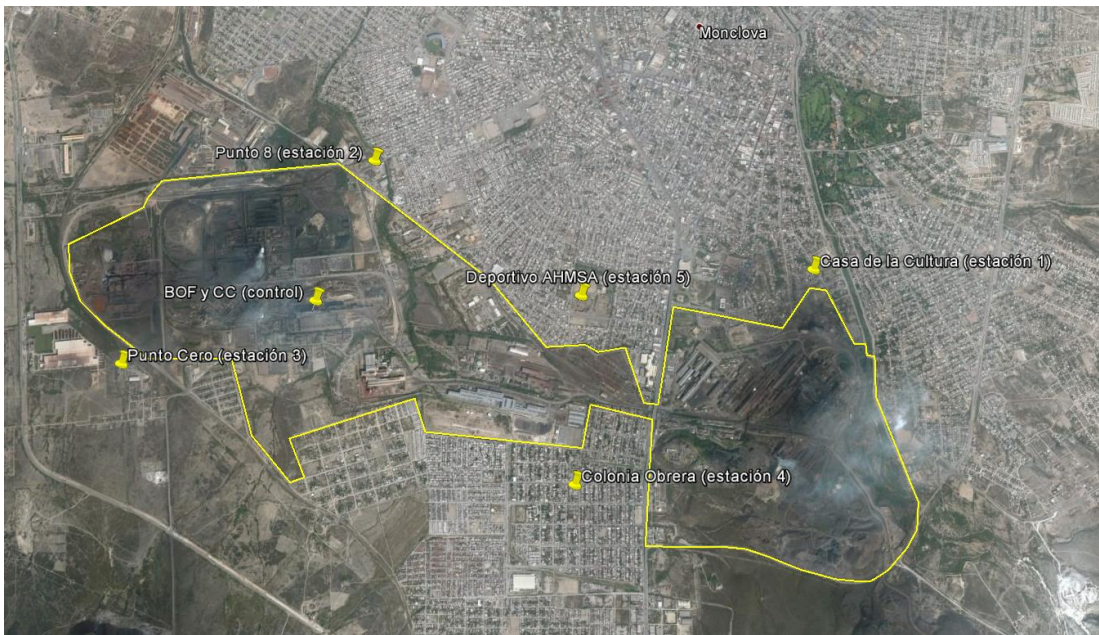
Figura 2 RED DE MONITOREO DE AHMSA

Los vientos predominantes con dirección hacia el norte en Monclova han contribuido a que se registren concentraciones más altas en las estaciones denominadas Punto Cero (Estación 3) y Punto 8 (Estación 2), las cuales reportan concentraciones medias anuales de 549.2 microgramos/m 3 y 399.2 microgramos/m 3 de PST, respectivamente.