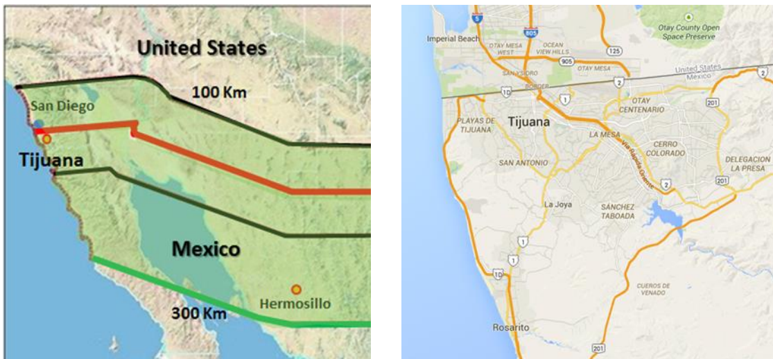
Figura 1 MAPA DE LOCALIZACIÓN DEL PROYECTO