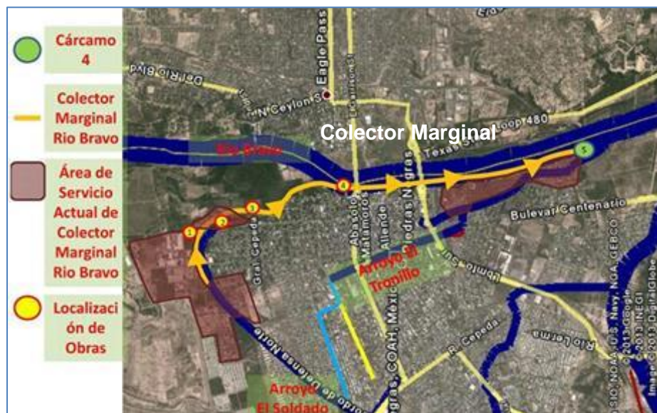
Figura 2 ZONA DE PROYECTO

La figura 2 muestra un esquema general de los componentes del proyecto: