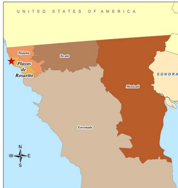
Figura 1.1 Playas de Rosarito, Baja California, México