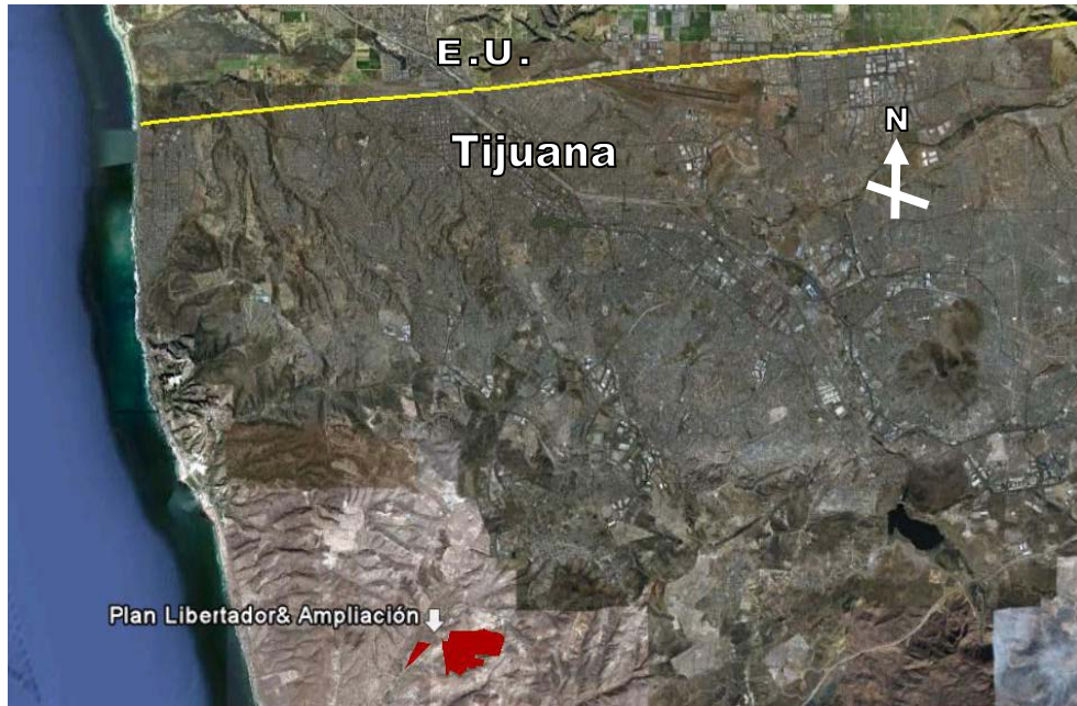
Figura 1.2 Plan Libertador y Ampliación en Playas de Rosarito, BC